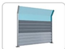
7. Акустические экраны