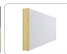
6. Сэндвич-панели (PIR и минераловатные)