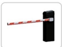
12. Системы автоматизации