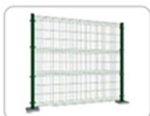
8. Системы ограждений