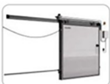
11. Двери для охлаждаемых помещений