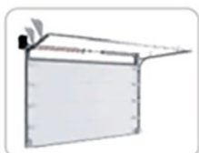
9. Промышленные ворота