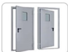
10. Двери технические