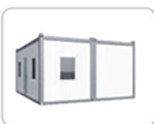
3. Модульные здания