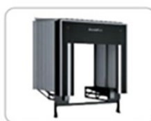
4. Складское оборудование